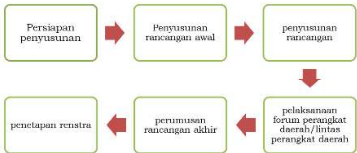
Gambar 1.2 Tahapan Penyusunan Renstra Kecamatan Klambu Kabupaten Grobogan

Penyusunan Renstra Kecamatan Klambu Kabupaten Grobogan mengacu pada dokumen RPJMD Kabupaten Grobogan Tahun 2021-2026 yang ditetapkan dengan Peraturan Daerah Kabupaten Grobogan Nomor 8 Tahun 2021 tentang Rencana Pembangunan Jangka Menengah Daerah Kabupaten Grobogan Tahun 2021–2026.